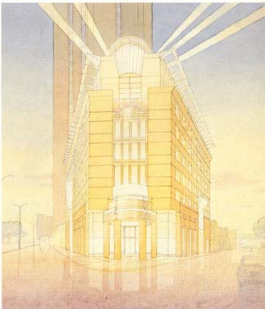
מבט ממרכז הכרמל/אלטרנטיבה A

בית כרמילו הוא פרויקט תיירותי הכולל מלונת ומרכז מסחרי. המלונת כוללת 73 יחידות דיור בגדלים שונים וכן פונקציות ציבוריות המשרתות את היחידות כגון: לובי, מסעדה, משרדים, שרותי משק בית וכו'. בקומת הקרקע מתוכנן מרכז מסחרי בהיקף של כ-700 מ"ר הכולל חנויות, בתי קפה, גלריות וכיכר ציבורית הפתוחה לרחוב, וכן חניון תת קרקעי של 120 מכוניות.