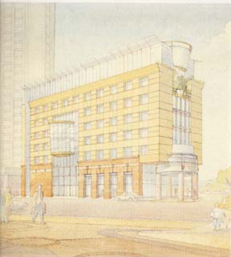
מבט מגן האם/אלטרנטיבה A