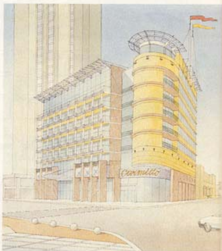
מבט מגן האם/אלטרנטיבה B