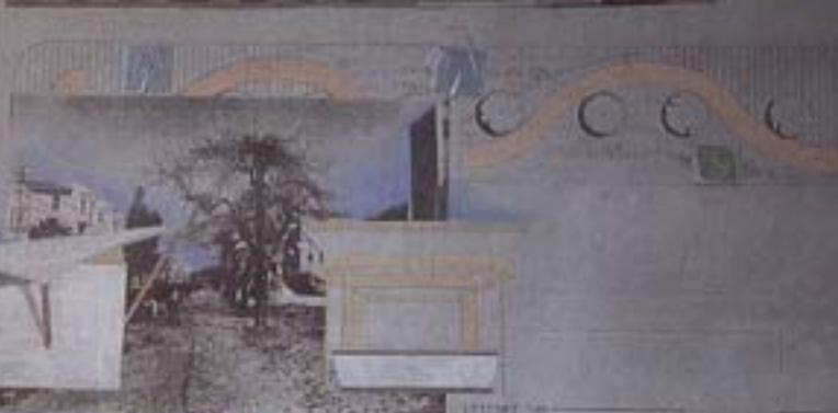
קי וסק - שער לשדירה

▲ אריאל וינטר - יצירת שער לשדירה ע"י הוספת קיוסק חדש ליד הקיוסק הקיים.