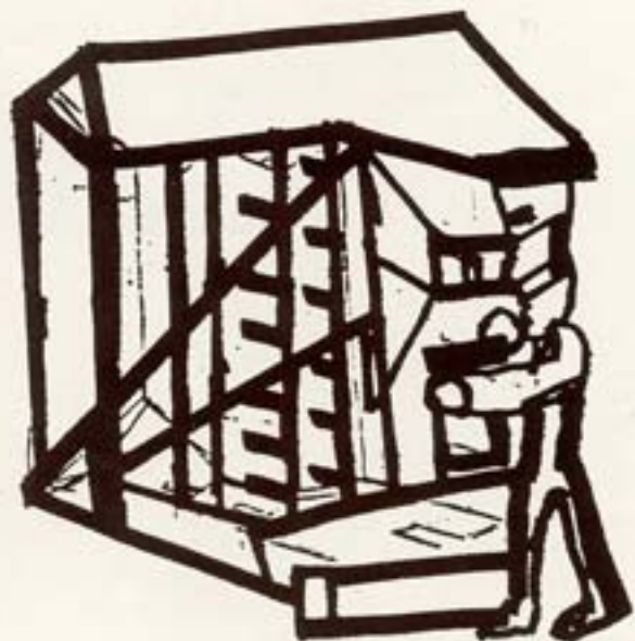
▲ מנחם כהרצון