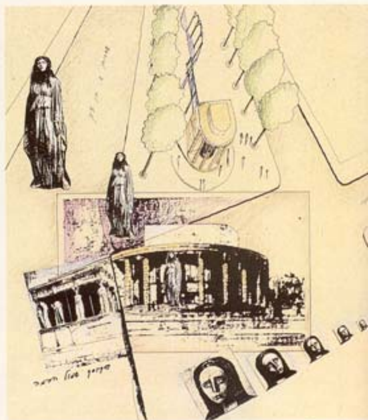
▲ בתיה מלול - הקיוסק מציע מחווה לבית הבימה המקורי ששינה את אופיו ותכניו האורבניים המקוריים