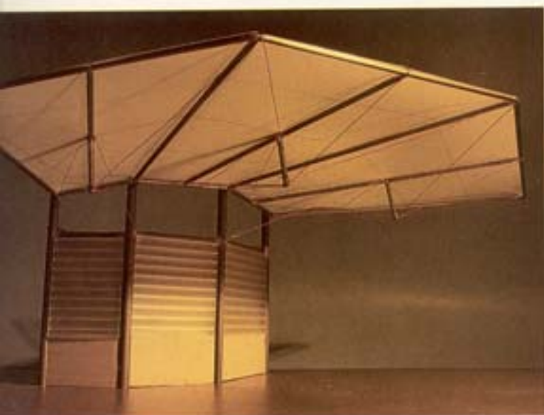
▲ שמעון פילצר וחיים דותן - הקיוסק מעוצב כחופה קלילה הנותנת מחסה משמש וגשם עשויה יריעת בד מתוחה ע"י מוטות וכבלים