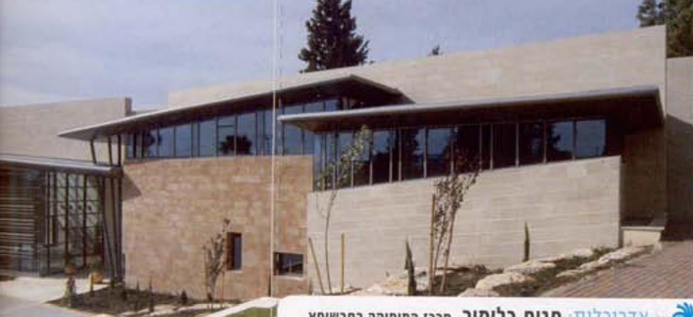
אדריכלות: תגית כלימור, מרכז המוסיקה בתרשיחא