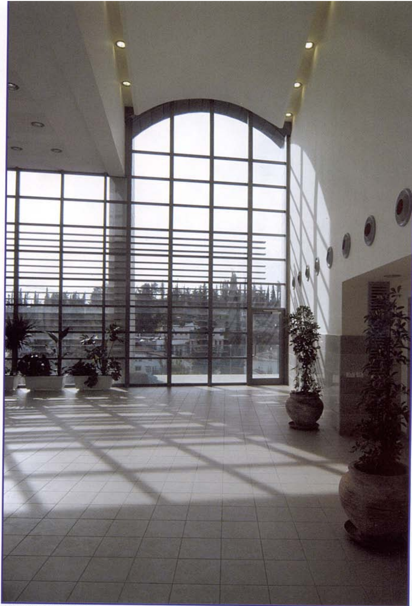
חלל אולם הכניסה והנוף הנשקף ממנו

המפגש הדמוגרפי, האתני והתרבותי בחלל של יצירה כמו מרכז המחיקה יוצר רגע יוצא דופן להרהור ארכיטקטוני. מעבר ליצירת מקום לאצירת צלילים ולחנים, זהו מקום שמתקיים בו רב-שיח תרבותי, דיון יצירתי מפרה והקשבה לרבדים הרעיוניים תוך שמירת האיכויות וכיבוד המסורות השונות המאפיינות את היישוב.