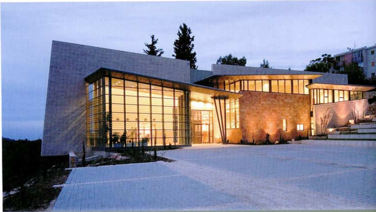
Third Place (shared) - Architecture Category Ma'alot Tarshiha Conservatory. David Knafo-Tagit Klimor Architects. Openness to the scenery grants an appropriate atmosphere for tolerant encounters of people of different cultures. The plan, made of "dancing" spaces of stone and glass, emphasizes the importance of the building in its aging surrounding